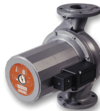
EMB Stratos 65/1-9

Energieeinsparung 44 % Alt: 685.40CHF / Neu: 383.80CHF